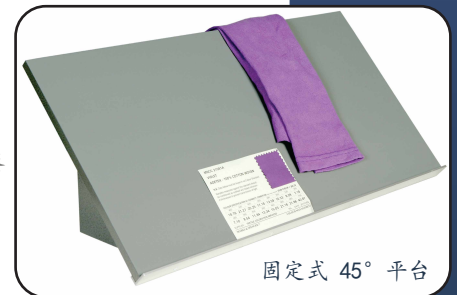
固定式 45° 平臺